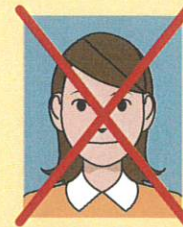
顔写真は不要です